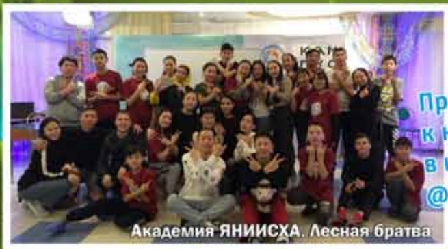
Академия ЯНИИСХА. Лесная братва

Присоединяйтесь к нашей страничке в инстаграм @sosnovybor_ykt