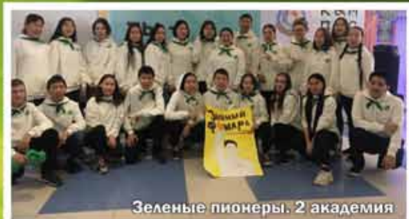
Зеленые пионеры. 2 академия