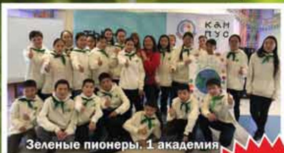
Зеленые пионеры. 1 академия