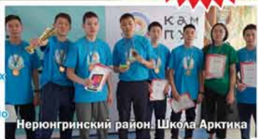
Нерюнгринский район. Школа Арктика

НАШИ ХЭШТЕГИ: по ним вы сможете нас найти в социальных сетях #sosnovybor_ykt #ялюблюслюбитменя #бытьснами_житьинтересно